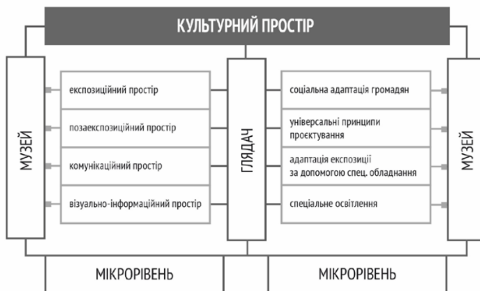
2. Структура культурного простору музею на мікрорівні [34, с. 79] з урахуванням інклюзивності