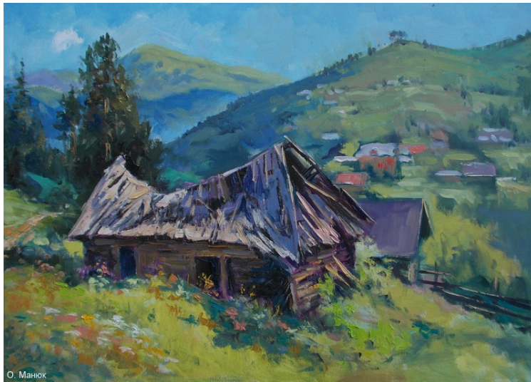
Іл. 10. Орест Манюк. Пам'ять гір. 2013. Пол., олія.