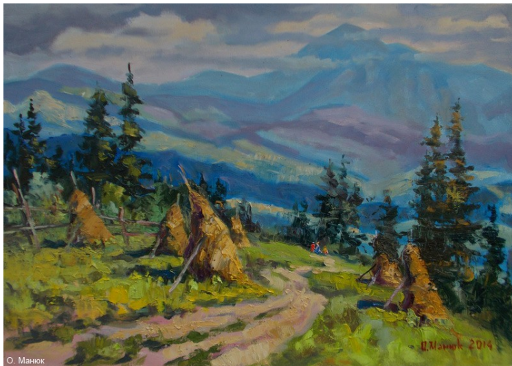
Іл. 10-а. Орест Манюк. Під Говерлою. 2014. Пол., олія.