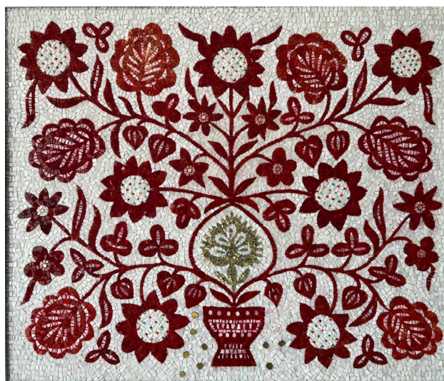
Іл. 3. Емілі Міллер. «Дерево життя із золотим серцем» Мозаїка за зразком народної вишивки XIX ст. 2018 рік. Матеріал: венеціанське скло, сусальне золото.