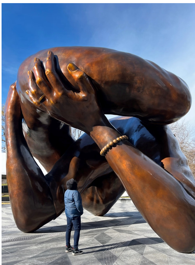
Іл. 6. Hank Willis Thomas. «The Embrace/Обійми». Бронза, 2023. Пам'ятник на честь Мартіна Лютера-Кінга молодшого та його дружини, письменниці Коретти Скотт Кінг. Бостон. Массачусетс.