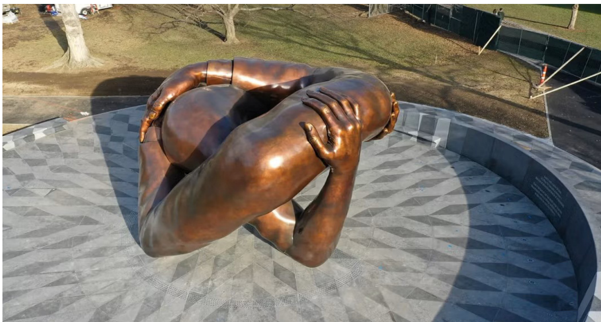
Іл. 6-а. Hank Willis Thomas. «The Embrace/Обійми».