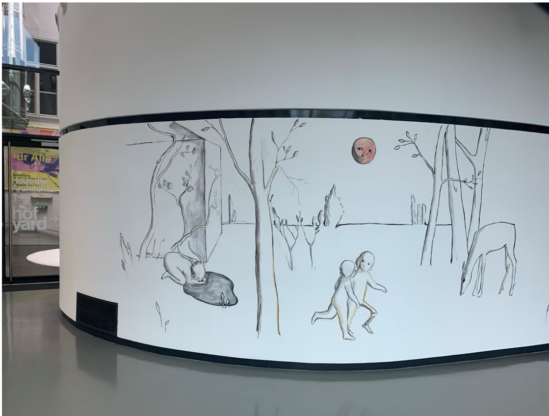
Іл. 8. Катерина Лисовенко. Мурал «Paint Anyway», або «Безсоромна земля не залишається мертвою надто довго». Kunsthau Graz, Österreich. 2022.