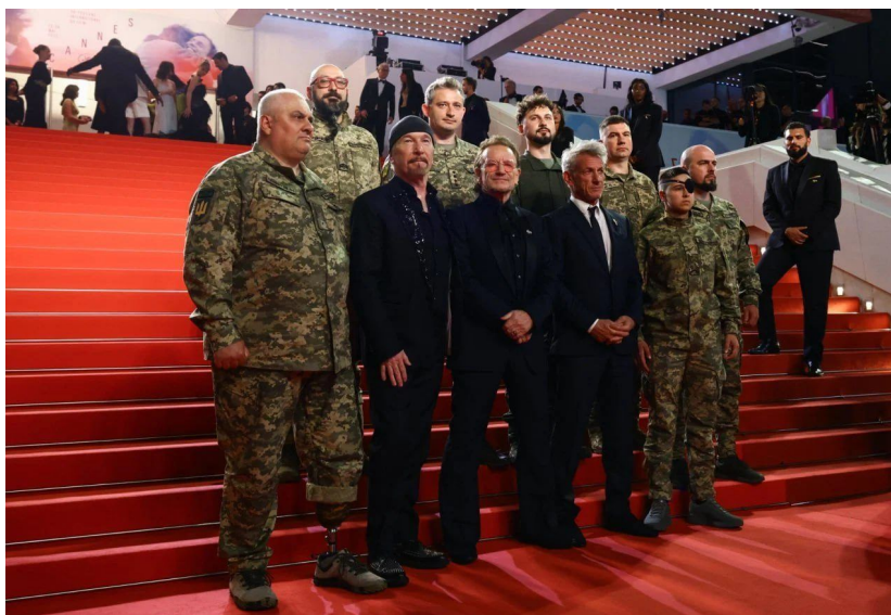
Іл. 4. 78-й Канський кінофестиваль. Шон Пенн, Боно та Культурна сила ЗСУ. 2025.