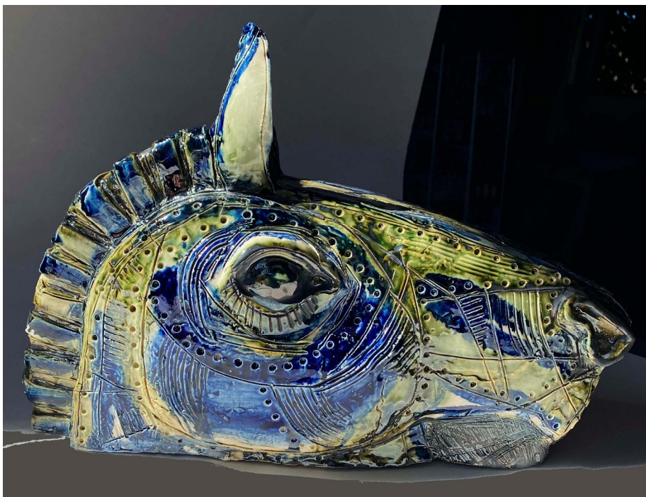
Іл. 3. Ірина Вештак-Остроменська. «Прислухається», серія «Кінь» 2025, порцеляна, підполивний розпис.