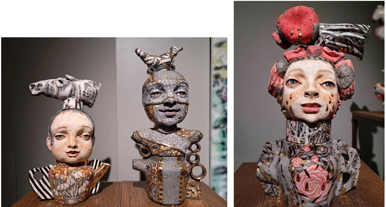
Іл. 1. Фрагмент експозиції «Свідчення. Молитви», 2025.