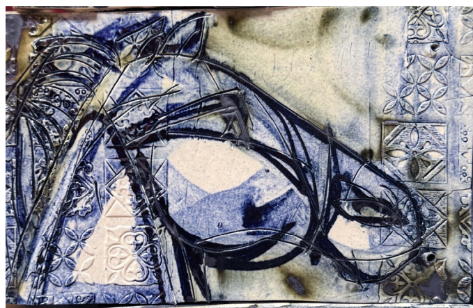
Іл. 6. Ірина Вештак-Остроменська. «Бароковий кінь». 2026, порцеляна, підполивний розпис.