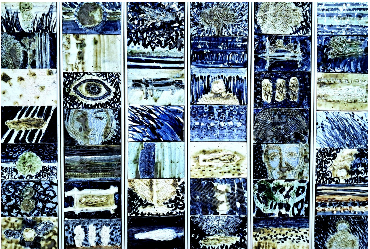
Іл. 2. Фрагмент експозиції «Кобальт. Cobalt», 2025.