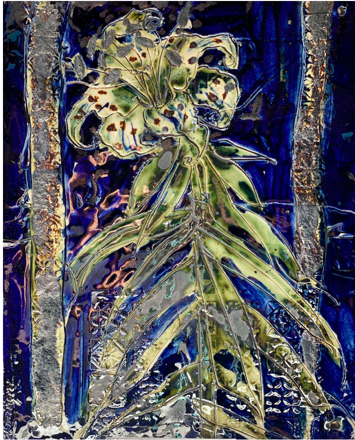
Іл. 7. Ірина Вештак-Остроменська. «Лілія». 2025, порцеляна, підполивний розпис.